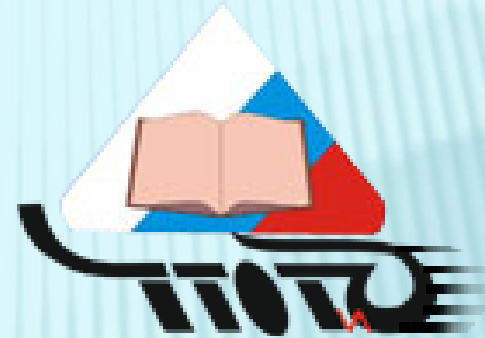
Читинский техникум отраслевых технологий и бизнеса