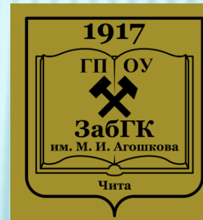
Забайкальский горный колледж имени М.И. Агошкова