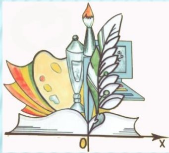
Читинский педагогический колледж